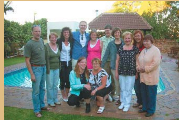
"Tämän porukan kanssa voi lähteä ihan minne vaan," tuumasivat matkalaiset.

Healing Rooms Finland ry siunaa Jeesuksen nimessä tehtävää Jumalan valtakunnan työtä kaikkialla maailmassa. Uskomme, että Jumala toimii monin tavoin, monia muotoja ja erilaisia palvelijoita käyttäen. Matkakertomus on yksittäisten henkilöiden kokemuksiin perustuva todistus Jumalan suuruudesta ja ihmeteista. Tuokoon se kunnian ja ylistyksen Jumalalle, Herrallemme Jeesukselle Kristukselle, ja rohkaikoon meitä kaikkia!