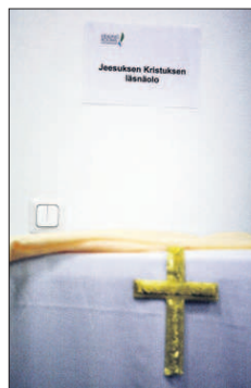
Asukastila muuttuu rukousklinikaksi kahdesti kuukaudessa.